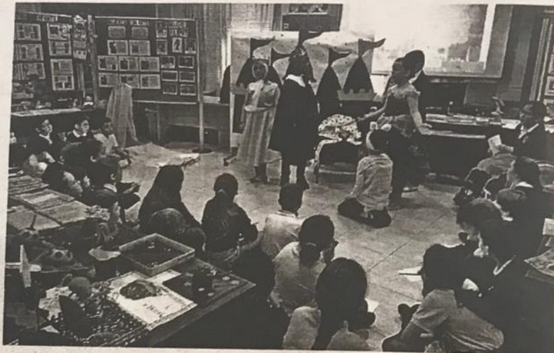
Alumnos viendo la obra '¿Hay algo más aburrido que ser una princesa rosa?'

Del mismo modo, el viernes, junto a las Aulas de Juventud que acudirán al centro, se realizará una lectura colectiva, en la que los niños compartirán con sus compañeros un libro propio, se leerá un manifiesto y se dará paso a la música y al baile. Asimismo, los padres pueden acudir a la muestra