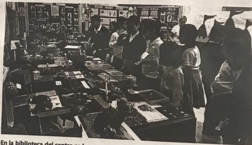
En la biblioteca del centro se han expuesto los diferentes trabajos de los alumnos

de trabajos de los alumnos, desde el lunes hasta el viernes, de 14:00 a 15:00, en la biblioteca.